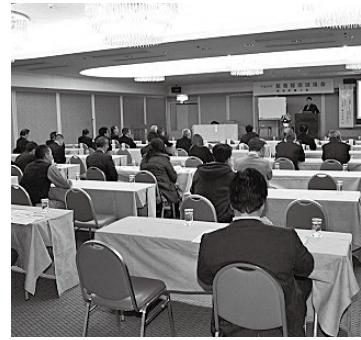
参加者は真剣に聴き入った

新春経済講演会は、一月二十五日に第五回理事会のあと、インスパイア(株)の代表取締役