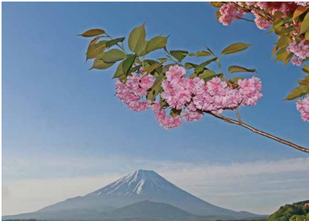
満開の八重桜越しに早春の富士を望む